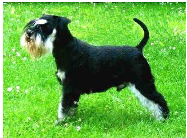
Ironman & Giorgio Armani Magic Merlin