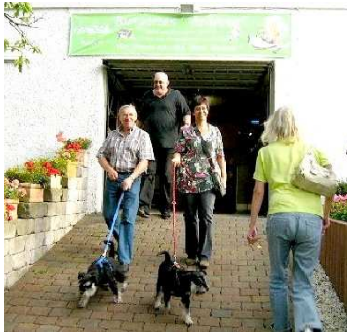
Die 2 x 2 Ausreißer kehren zurück.

jedoch waren 2 x 2 Zwei- und Vierbeiner (CH) mal schnell im Wald oder auf der Wiese verschwunden und mussten zurück geholt werden.