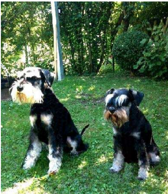
Jaden & I love Magic Merlin (Finja)