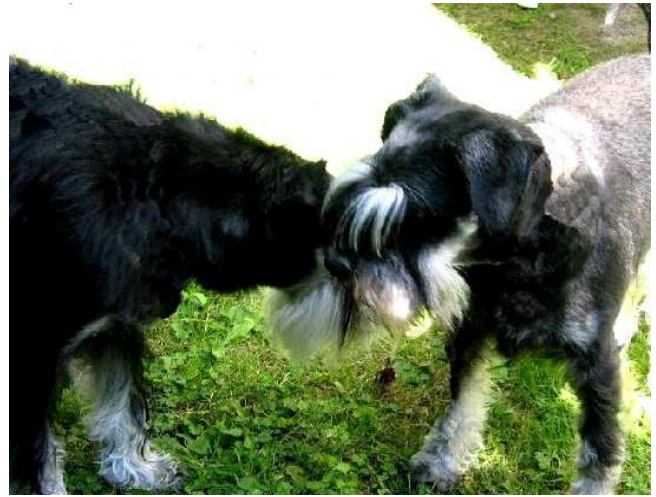
Melody & Indian Summer Magic Merlin