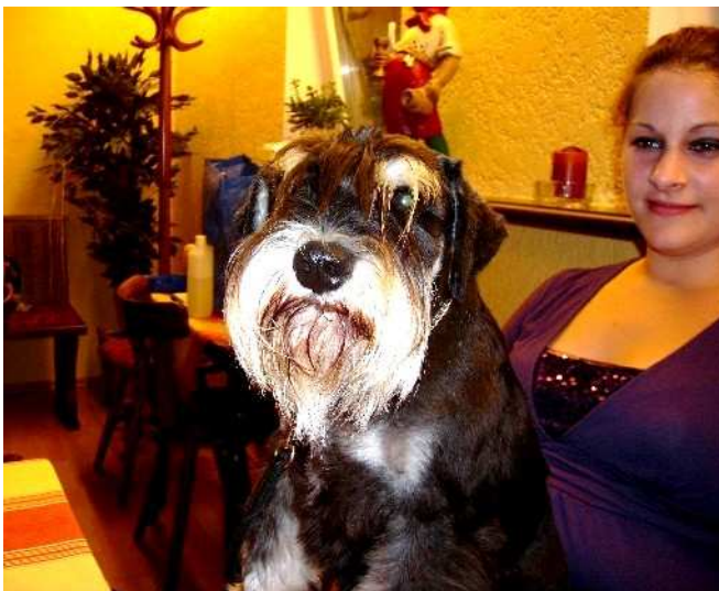
Nina & Only Magic Merlin