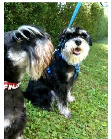
I love & Indian Summer