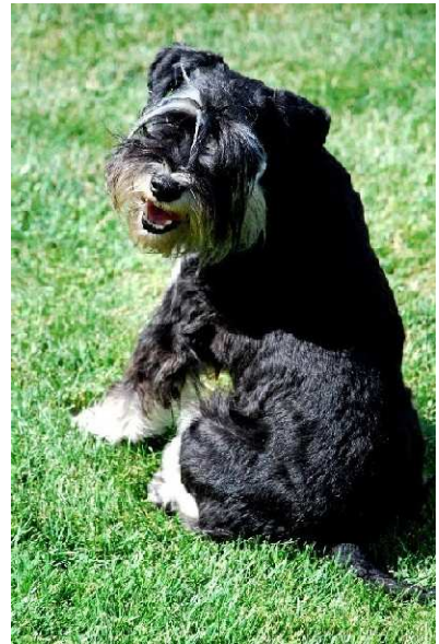
Nike Magic Merlin

jedoch waren 2 x 2 Zwei- und Vierbeiner (CH) mal schnell im Wald oder auf der Wiese verschwunden und mussten zurück geholt werden.