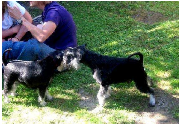
I love (Finja) mit Bruder Ironman Magic Merlin